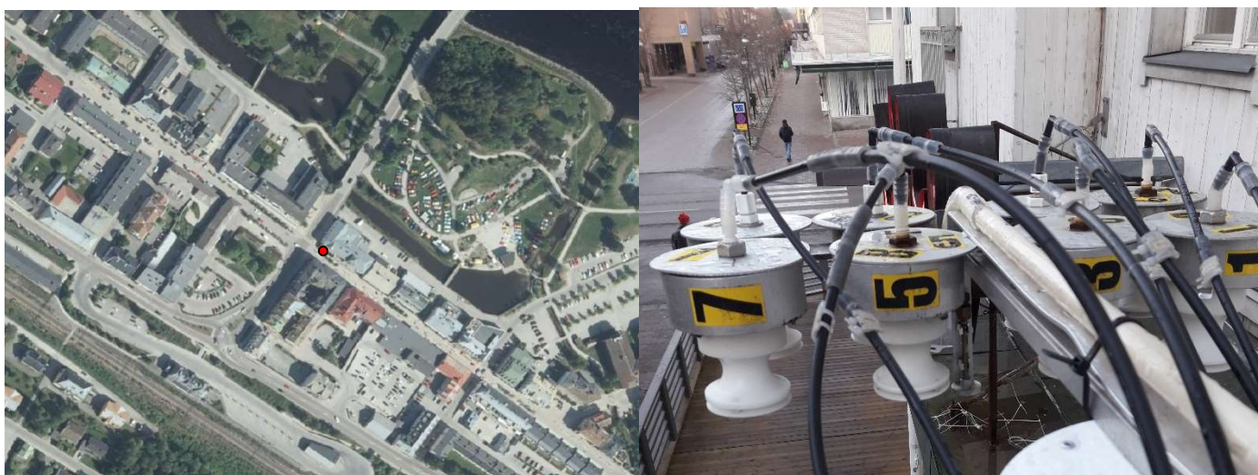
Figur 3 och 4 Storgatan, Sollefteå kommun