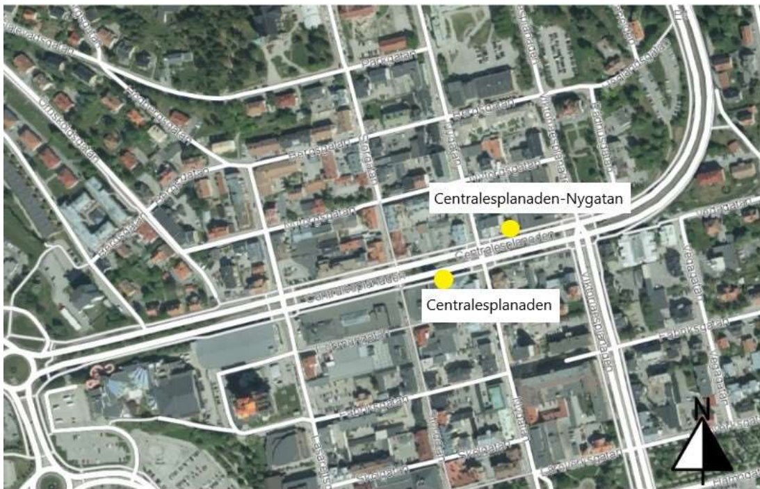
Figur 12 Centralesplanaden och Centralesplanaden-Nygatan , Örnköldsviks kommun