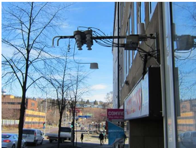
Figur 13 Centralesplanaden.