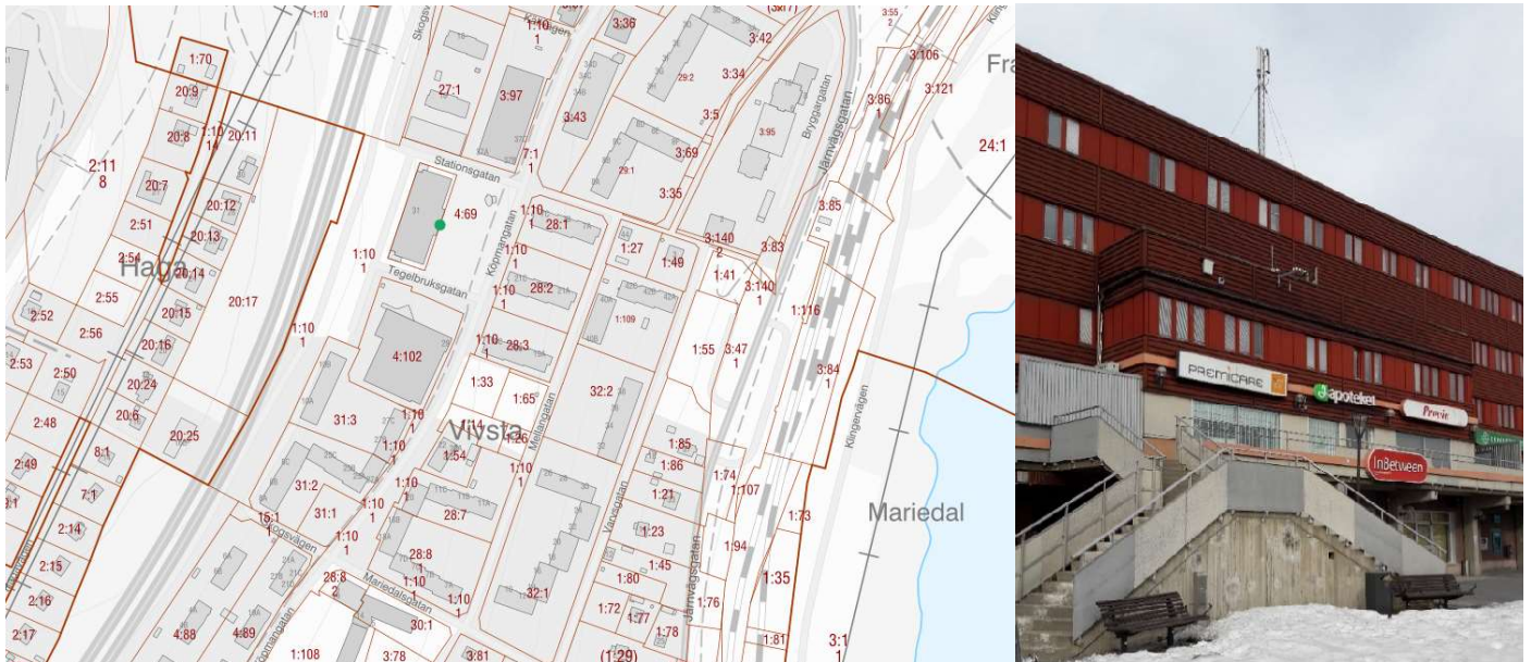
Figur 8 och 9 Torget, Köpmangatan, Timrå kommun