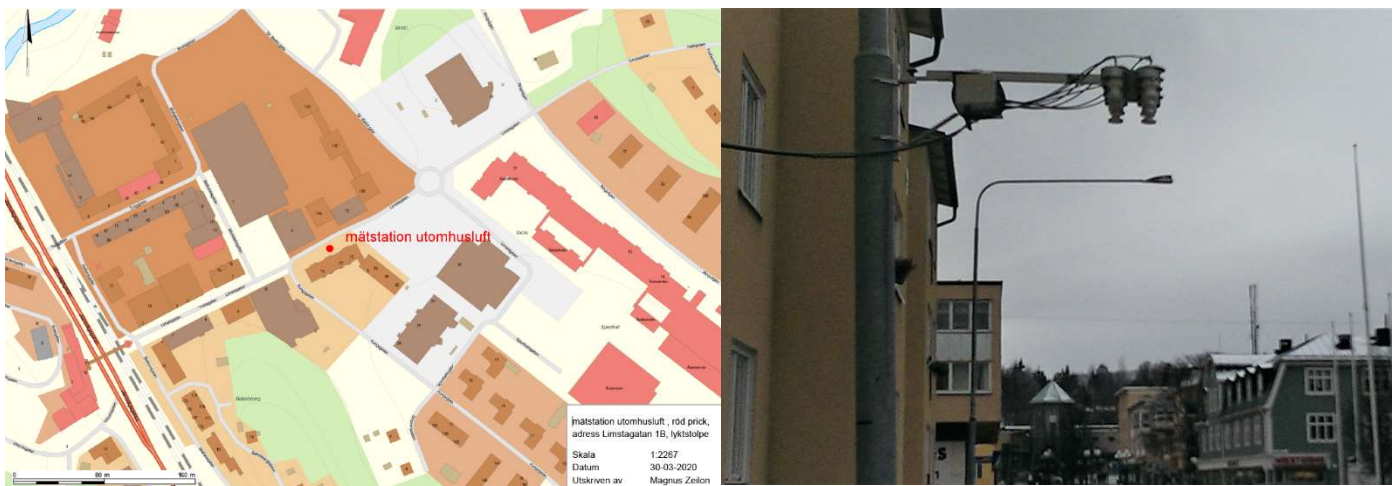
Figur 10 och 11 Limstagan, Kramfors kommun