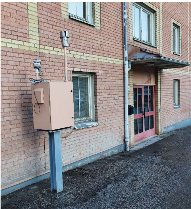
Figur 6 Köpmangatan, figur 7 Bergsgatan, Sundsvalls kommun