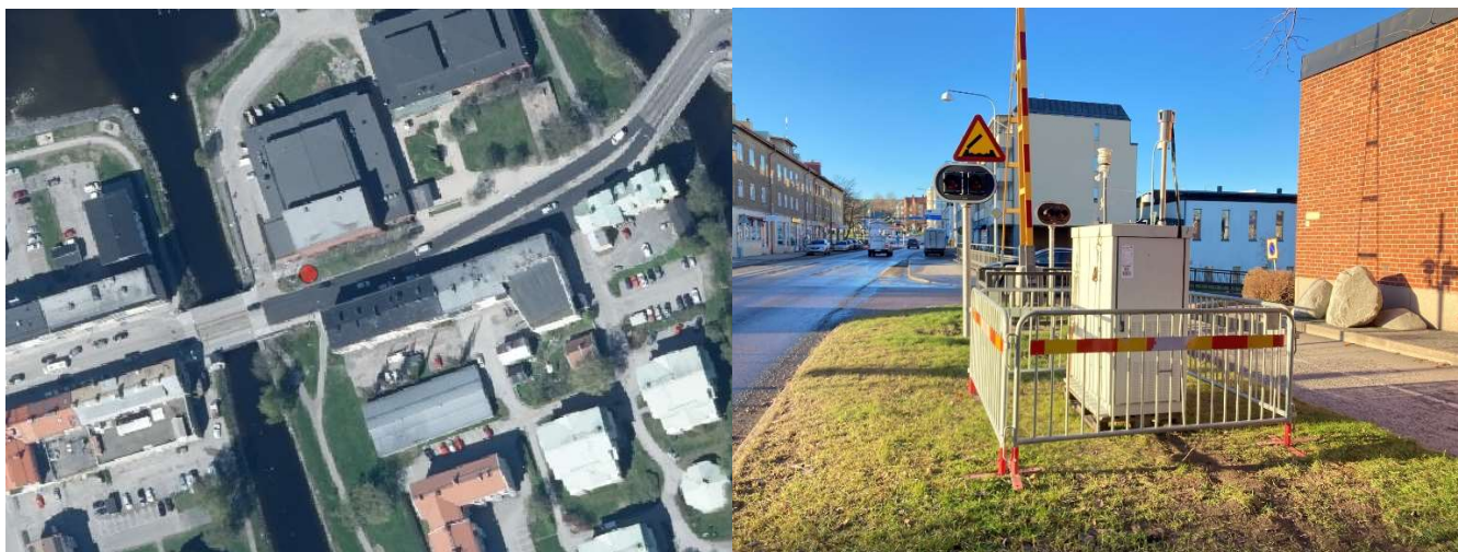
Figur 1 och 2 Storgatan 12A, Härnösands kommun