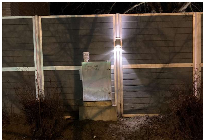
Figur 14 Centralesplanaden-Nygatan, Örnköldsviks kommun